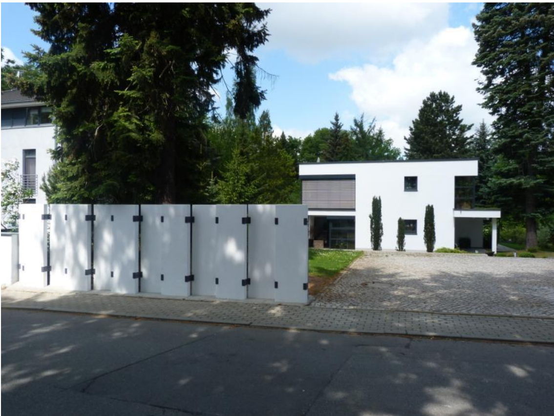
Beschreibung: Zaunanlage aus weißen Sichtbetonwandscheiben