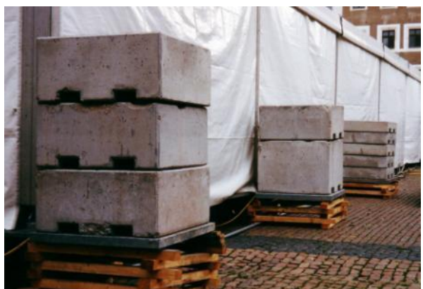
Gegengewicht für Veranstaltungszelte