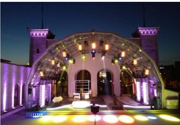
Waldis-Club zur EM 2012 in Leipzig