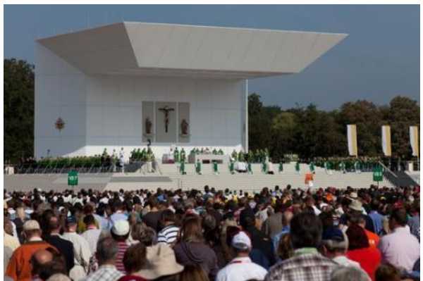
Altarinsel für den Papstbesuch 2011 in Freiburg